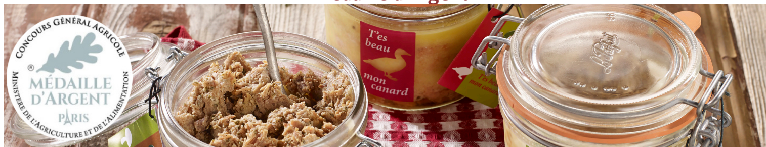
«T'es Beau Mon Canard» La Terrine Rustique de Canard - Conserve Médaille d'Argent