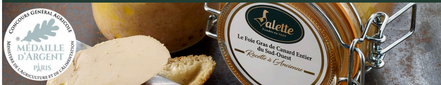
Le Foie Gras de Canard Entier du Sud-Ouest / Périgord «Recette à l'ancienne» - Conserve Médaille d'Argent

Un palmarès qui conforte le savoir-faire de la Maison familiale à l'aube de son 100 ème anniversaire . En plus de 30 ans de participation au Concours, 65 médailles attestent le savoir-faire, l'authenticité et la qualité des produits de la Maison Valette.